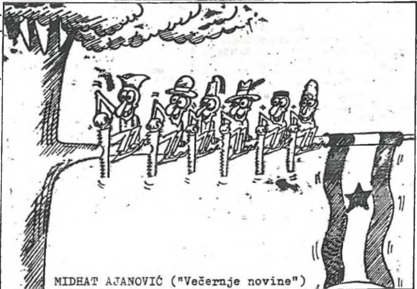
MIDHAT AJANOVIĆ ("Večernje novine")

Východní Evropou už zase obchází strašidlo. Tentokrát je to strašidlo separace. Stojí za námahu se zamyslet proč právě my, Slované, vždycky skočíme na nějakou zaručenou teorii vymyšlenou na západě. Podle jisté teorie je prý tím, že již v dávné minulosti nás naši kmenoví ná-