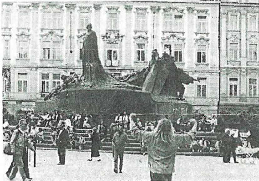
Pomník Mistra Jana Husa na Staroměstském náměstí v Praze je pro návštěvníky z celého světa, zejména pro krajany a exulanty, místem vzpomínek, zamyšlení i inspirací. Nutí k tomu i jeden z vytesaných nápisů: „Věřím, že vláda věci tvých k tobě se zase navrátí, národe český.“

Někdo trval v cizině na tom, že není emigrant, nýbrž exulant, snad s historickým odvoláním na Jana Ámose Komenského, snad proto, aby dres mužstva byl vymezen, snad z nějakých jiných důvo-