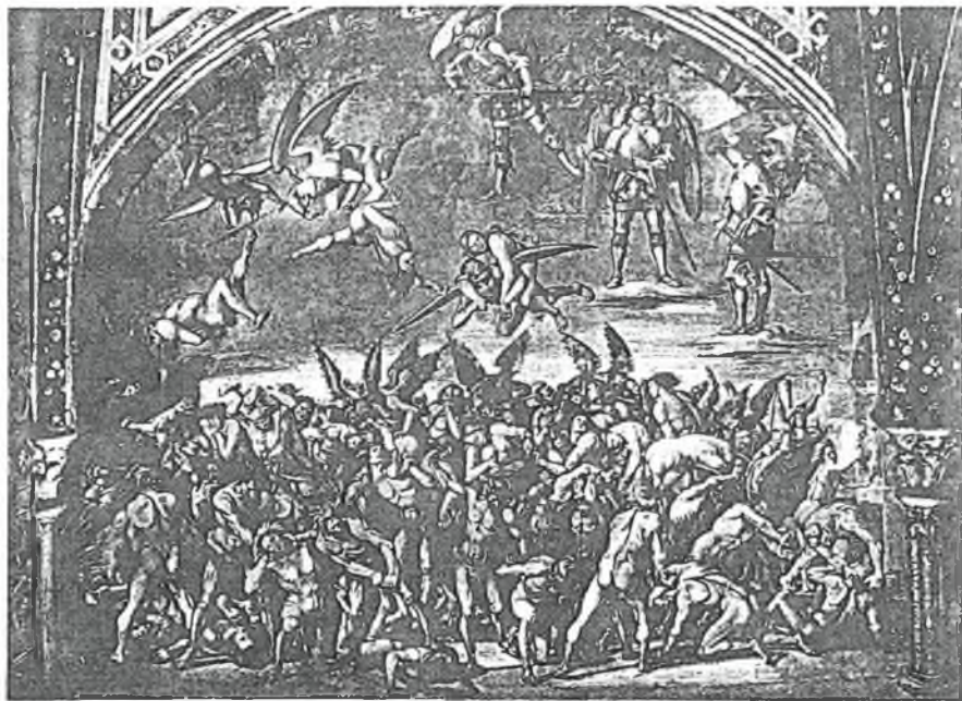
ORVIETO - Duomo - "I condannati all'Inferno" (Sipioneelli)

Asi před půlstoletím jsem napsala dopis gen.taj. OSN panu Trygve Lie:...jsme ve stalinských koncentracích, jsme vystaveni fyzickému a morálnímu násilí, hladu, ponižování lidské