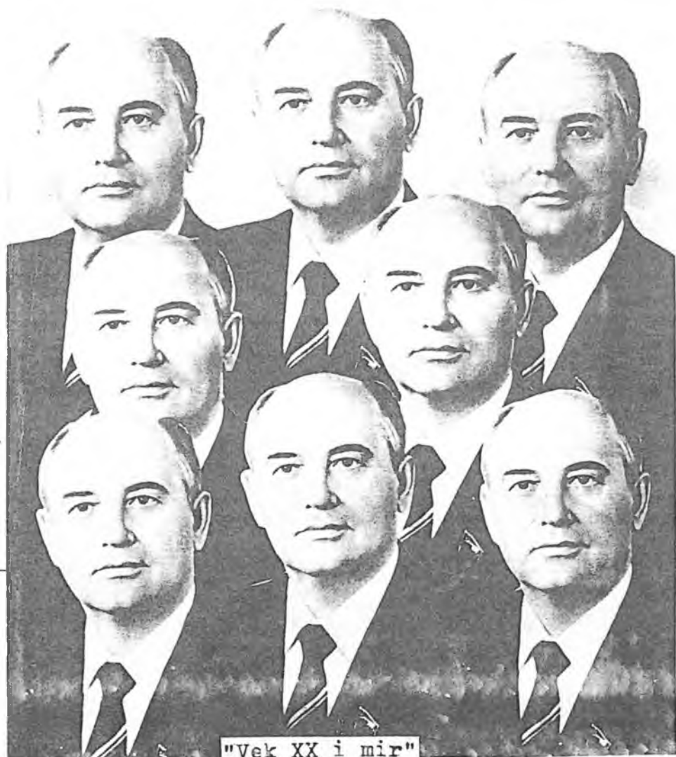
"Vek XX i mir"