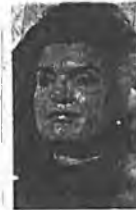
Jung durch Geld: Jackie Onassis, 60. Doppelte Witwe, Erbin von Millionen

Odpůrci střelných zbraní poukazují na nehody jimi způsobené. Australské statistiky nám nedovolí tento fakt dostatečně posoudit. Můžeme si však pomoci informacemi ze Spojených států,