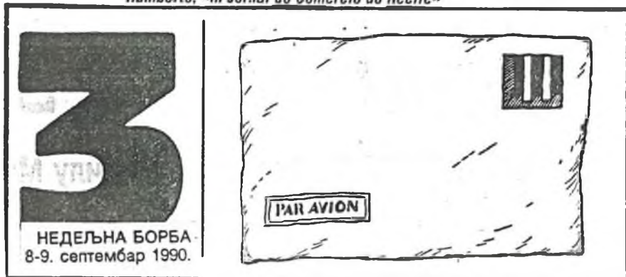
A visita do presidente Collor de Mello a Portugal vista pelo traço de Humberto. "in Jornal do Comércio do Recife"