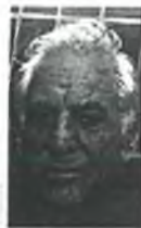
Jung durch Ruhm. Bernstein. 71. Lebensde Legende. Dirigiert täglich. Fit durch Jogging