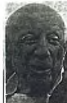
Jung durch Kunst. Picasso, wurde 91. Malte bis zum letzten Tag. Vier Frauen