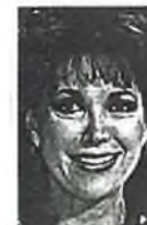
Jung durch Erfolg: Petra Schürmann, 54. „Miß Welt“, seitdem immer oben