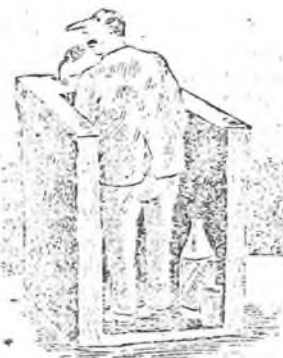
Рисунок Василия Дубова.