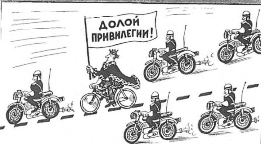
Рисунок Николая ЕЛИНА.

ДОЛОЙ ПРИВИЛЕГИИ! /Pryč s privilegii!/ Tak podle СССРУ в Советском svazu.