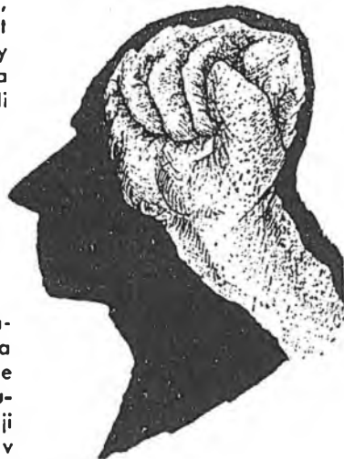
A.Červjakova /Moskva/ Molodoj komsomolec č.6/90

"Nemá smyslu a je předem odsouzen k nezdaru každý pokus stavěti se proti tomu, co přichází. To již proto, že v dobách, jaké prožíváme, lid volá po účinných opatřeních proti každé reakci(!). Nemá také smyslu zůstávat stranou velkého dění. Dříve či později musí stejně každý občan jasně projevit, kde stojí a co chce.(!).(24)