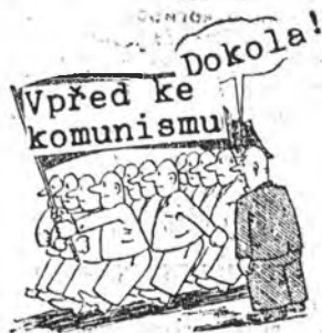
Рис. Г. ШТАУБЕРА.