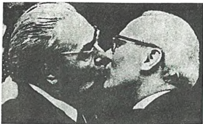
Erotika v KREMLU Brežněv-Honecker