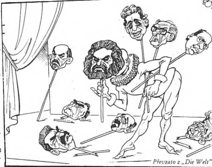
Lidské tváře socialismu

Reakční ruští komunisté na ustavujícím sjezdu zaútočili na M. Gorbačova a jeho politiku reforem, obviňujíc sovětského vůdce v tom, že vede zemi i stranu do katastrofy, vytvářejíc kolem sebe kult osobnosti. Během diskuze delegát za delegátem ho napadali, jeho program i stoupence. Čím tvrdší byla kritika, tím silnější následoval potlesk.