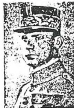
M. R. STEFANIK