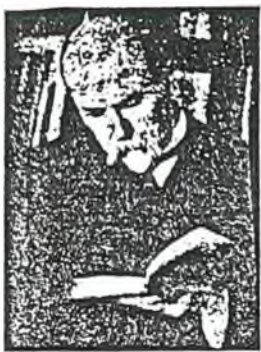
T. G. MASARYK