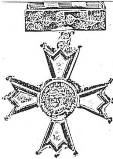
Řád Milana R. Štefánika