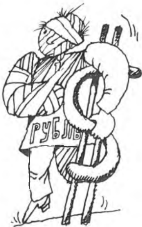
"R u b l" Bez peněz je klidnější spanek.