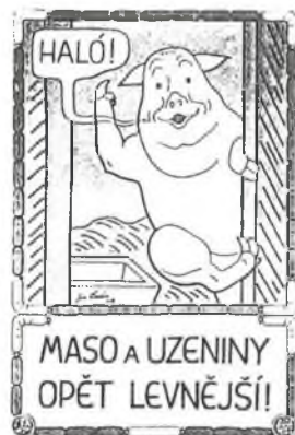
J. LADA, 1949

• Sedmdesát let uplynulo od výpravy prvního Čecha do Antarktidy . Byl jím Václav Vojtěch, rodák ze Skřivan u Nového Bydžova, který byl členem úspěšné americké expedice v roce 1929. - rp 28.1.99 -