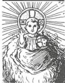
Kresba Mikoláše Alše