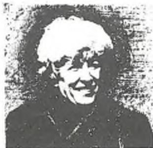
Pani Olga Havlová, předsedkyně Výboru dobré vůle.

Pohled na politiku tak říkajíc "zevnitř" mne jen utvrdil v jistotě, že dnešní dramaticky se proměňující a možná své globální zkázy si nepřipouštějící svět je velkou výzvou, kterou musí politika vyslyšet. Jde o to od základu jinak se chovat. A kdo jiný by měl začít než politici?