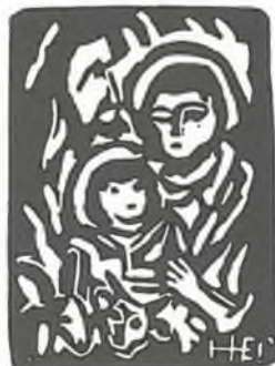
Cyril Heindl, Svatá rodina Linoryt ( 1987 )