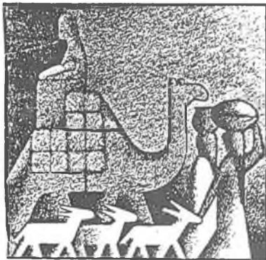
Václav Sokol Biblické ilustrace

Tento druhý způsob je velice lákavý, protože je spravedlivý (platicí by nedopláceli na neplaticí), kromě toho by se ušetřilo na poštovním.