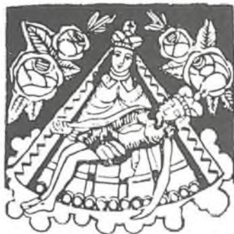
Lidový dřevorez z vých. Slovenska

Msgr. Vlk se na svého předchůdce ve chvíli "střídání stráží" obrátil těmito slovy: "Při osobních setkáních s Vámi v minulosti jsem byl vždy hluboce oslovován Vaší vírou a pevným zakotvením v Bohu. Cestou naší církve skrze kříž pronásledování ke vzkříšení ve svobodě, jste šel neohroženě jako pastýř před svým stádem. Vyslovujeme Vám vděčnost."