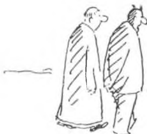
Kresba Vladimír Jiránek