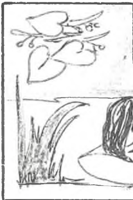
Přede hry, Viktor Dyk. (1877 - 1931)

V tom rozmachu, v tom výboji, v tom vzpětí, jež žasnouce tu vidíme, já ptám se: Dnes, kdy výše touhy letí, kam vy, ó Čechy mé?