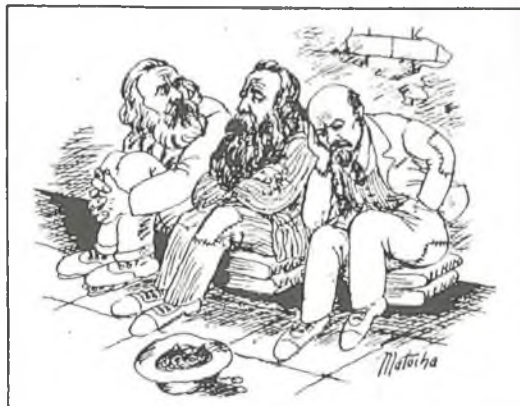
„Ale teorie přece souhlásí!” „Szpilki” – Varšava, c. 44/1989