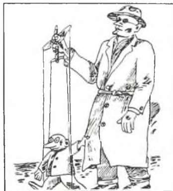
Karikatura z moskevského měsíčníku „Socialismus, teorie a praxe” – Moskva, c. 11/1989