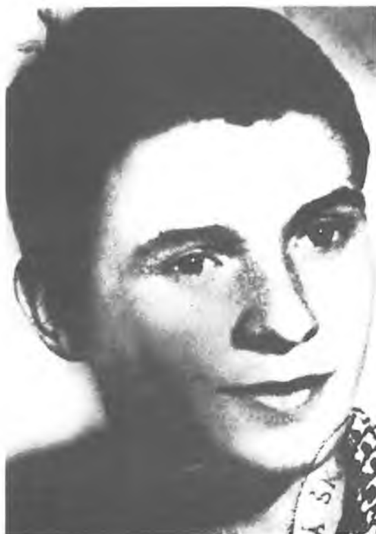
JAN PALACH – symbol, který ani po 20ti letech nelze uhasit.