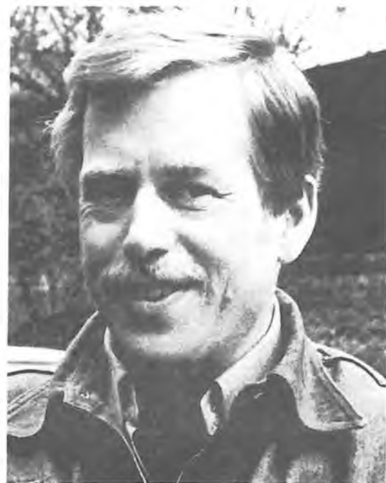
Čs. dramatik a spisovatel Václav Havel. Archivní snímek z r. 1978.