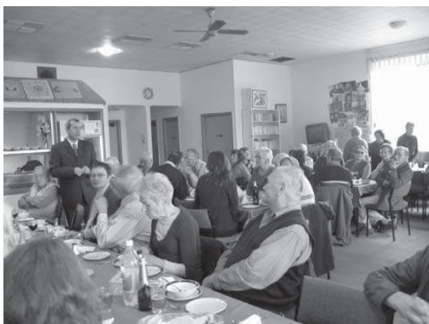
Z návštěvy generál. konzula a velvyslance