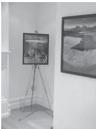
Z výstavy fotografií

Byl to rok změn i proměn. I v tomto roce se udělalo v Národním domě spousta práce a proběhla řada zdařilých akcí, např. každý měsíc (kromě července) byly organizovány