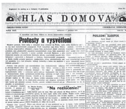
Poslední číslo Hlasu domova 17. prosinec 1979

Austrálie ho poctila medailí v roce 1975 British Empire Medal (ocenění za 25 let vydávání Hlasu domova), 1988 Order of Australia OAM. Až posmrtně, v roce 1997, je mu prezidentem V.Havlem udělena Medaile za zásluhu