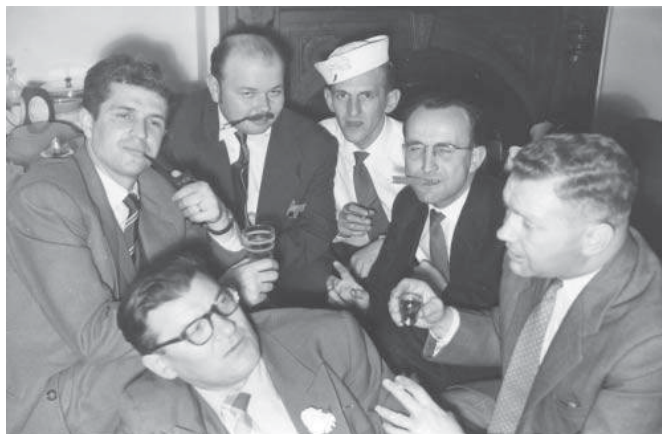
Redakční kruh a pomocníci 1955