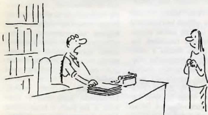
ROMÁN JE HOTOVÝ, MARIE! TEĎ JEŠTĚ Z NĚJ UDĚLAT TELEVIZNÍ HRU, FILMOVÝ SCÉNÁŘ A LEPORELO!

prázdnin (zřejmě reakce na dovolenou v Jugoslávii či kde a rozhodnutí se již domů nevrátit) a v české, rakouské, slovinské a slovenské koprodukci vzniklo šestidílné zastavení v životě lidí, kteří se rozhodli opustit vlast. Pro nás je to zažitá zkušenost, nikoliv však pro většinu lidí v ČR. Autoři a režisér Miloslav Luther zvolili pro zpracování dokumentaristickou formu, která mapuje vybrané dny několika náhodných rodin a jednotlivců. Vše začíná 21. června 1983, kdy se hlavní hrdinové televizního románu rozhodují k útěku za hranice. Každý volí jiný způsob, někteří přijdou k emigraci náhodně a jiní o ni dlouho uvažují. Autoři při zpracování látky vycházeli jednak ze svých