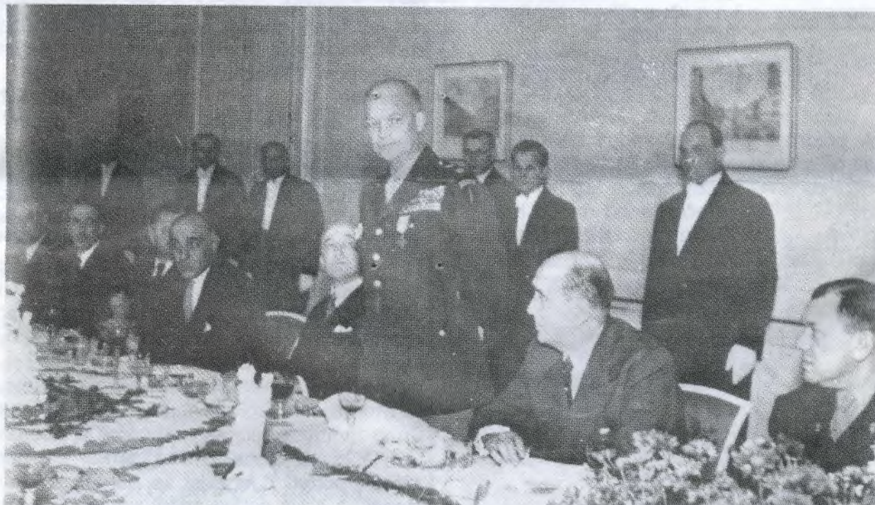
Vrchní velitel vylodění v Normandii - generál Dwight D. Eisenhower.

SOKOLSKÝ LIST SOKOL MELBOURNE 497 QUEENSBERRY ST., NTH. MELBOURNE, VICTORIA 3051