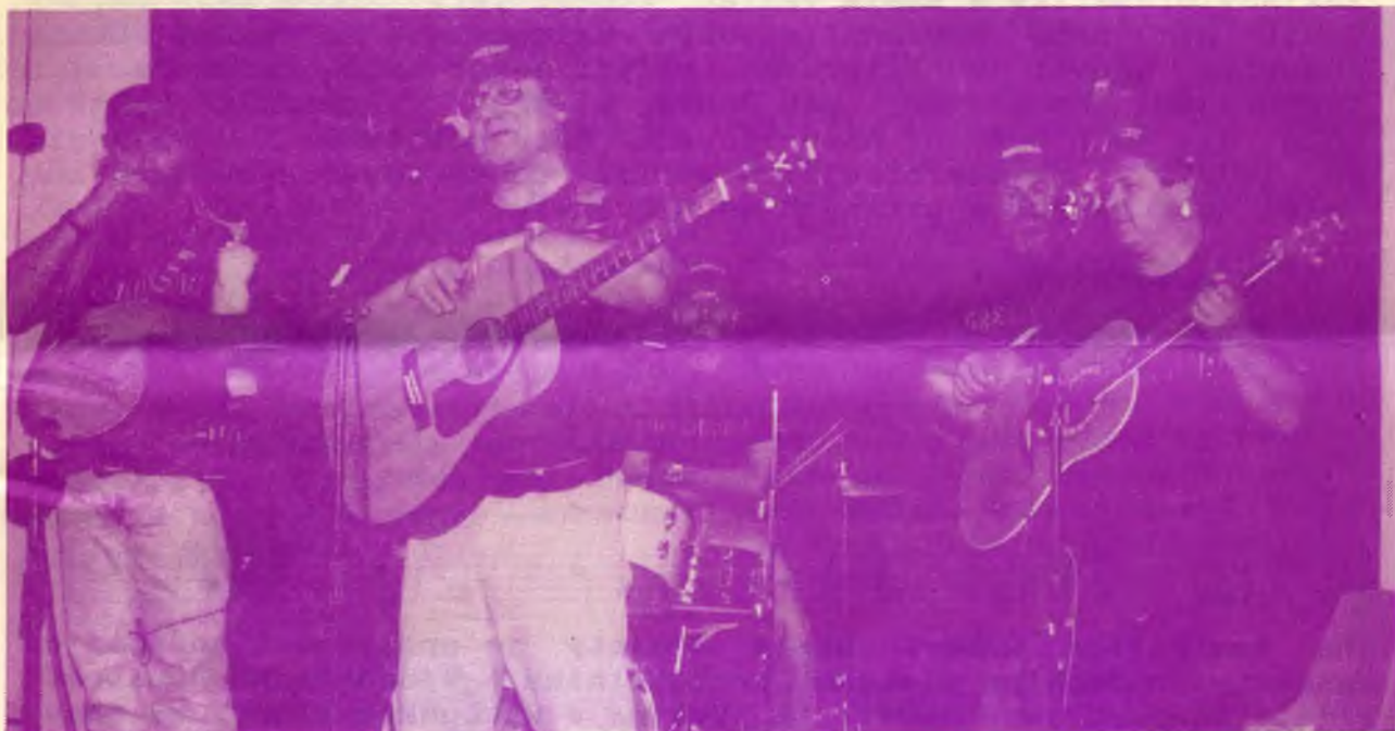
Koncert GREENHORNŮ v Národním domě.

V Austrálii si ani neuvědomujeme výsadu, které se nám dostává tím, že nás přijedou navštívit většinou špičkoví umělci z Čech anebo Slovenska. Vždyť přiblížit se i jenom na doslech obdobné skupině australských umělců by nebylo možné bez zdolání několika hradeb svalovců a jiných překážek. Někdy si také myslím, že naši privilegie zneužíváme a neprojevujeme respect, jakého si naši návštěvníci zaslouží.