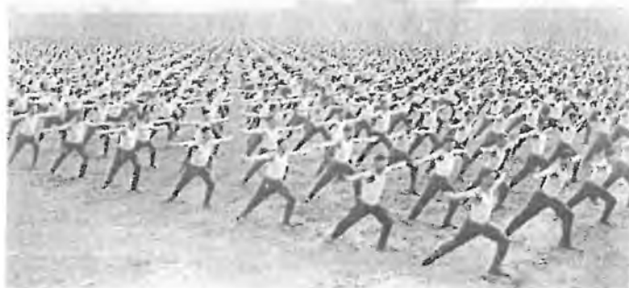
Cvičení mužů na VIII. všesokolském sletu

Na sletu vystoupilo celkem 84,200 sokolských cvičenců: 13,900 dorostenců, 14,200 dorostenek, 30,800 mužů a 25,300 žen. Mimo to vystoupily skupiny hostů a složky československé a jugoslávské armády.