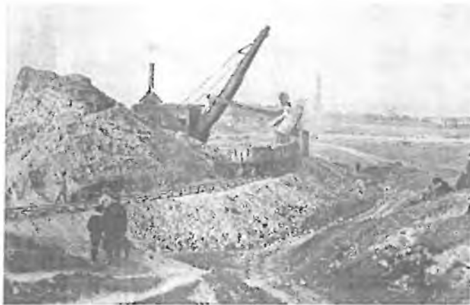
Úprava Strahovských lomů na sletový stadion

Ve znamení tohoto hesla, kterým sokolstvo potvrdilo svou naprostou soběstačnost a nezávislost, konal se před 80 lety VIII. všesokolský slet, první na Strahově, kde byl pozemek Strahovských lomů smlouvou ministerstva zdravotnictví a města Prahy z června 1925 postoupen na 80 let pro tělovýchovné účely. Po srovnání pozemku lomů byla na něm postupně vybudována sportovní učiliště; prvním byl velký stadion, který byl pak od VIII. sletu dějištěm čtyř dalších všesokolských sletů.