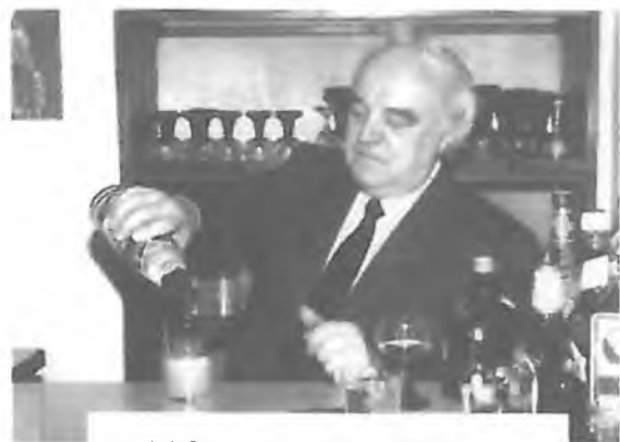
Tak kdo si dá ještě limonádu?

V květnu 2007 mu Pán dopřál v síle i humoru sobě vlastním oslavit své 75. narozeniny v kruhu nejbližších kněží, mezi českými a německými farníky a přáteli v Norimberku, i s přáteli a známými v Praze.