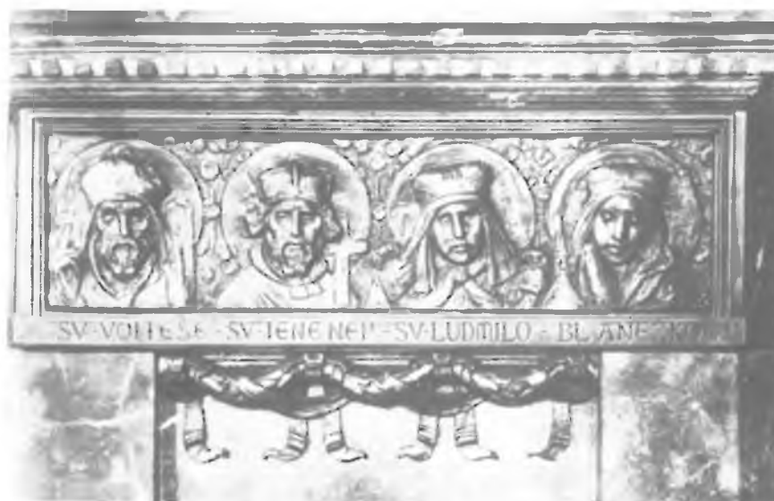
J.V.Myslbeek: Relief s podobami některých českých patronů: Sv.Vojtěch, Sv.Jan Nepomucký, Sv.Ludmila, Sv.Anežka Česká