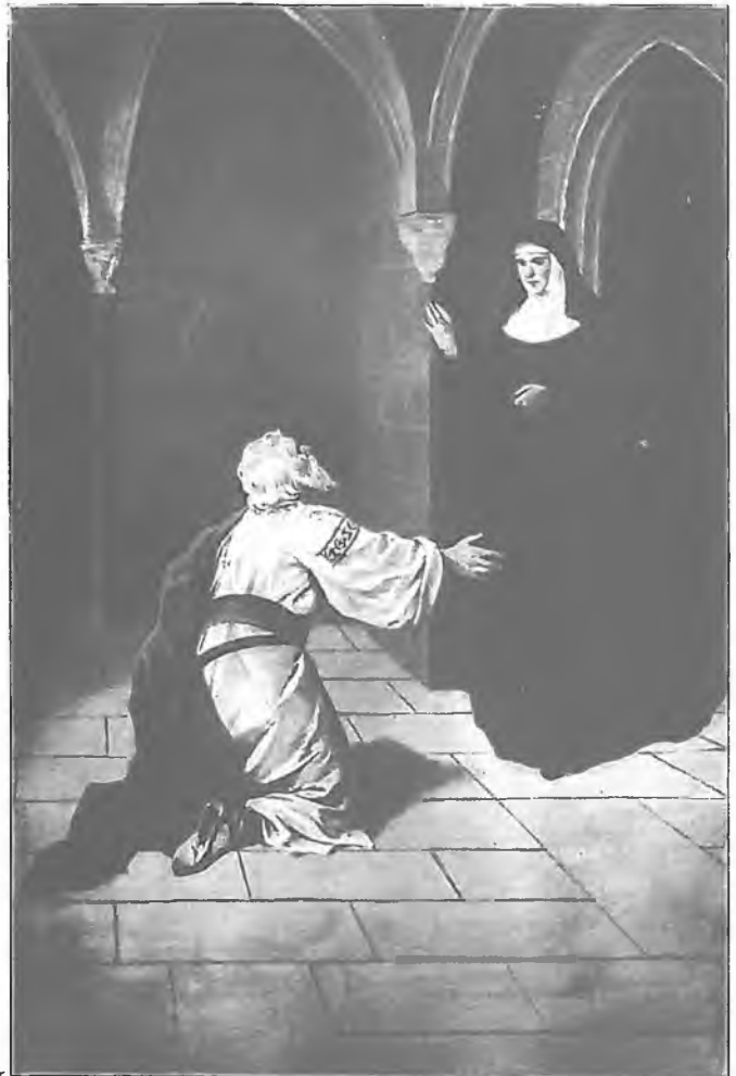
Věnceslav Černý: Ilustrace k povídce "Smíření" od A.Dostála Pomocnice svého lidu na zemi, orodovnice za svůj lid na nebi

(Úvodní modlitba ze mši ke cti bl.Anežky České, jak jsme se jí dosud modlili.)