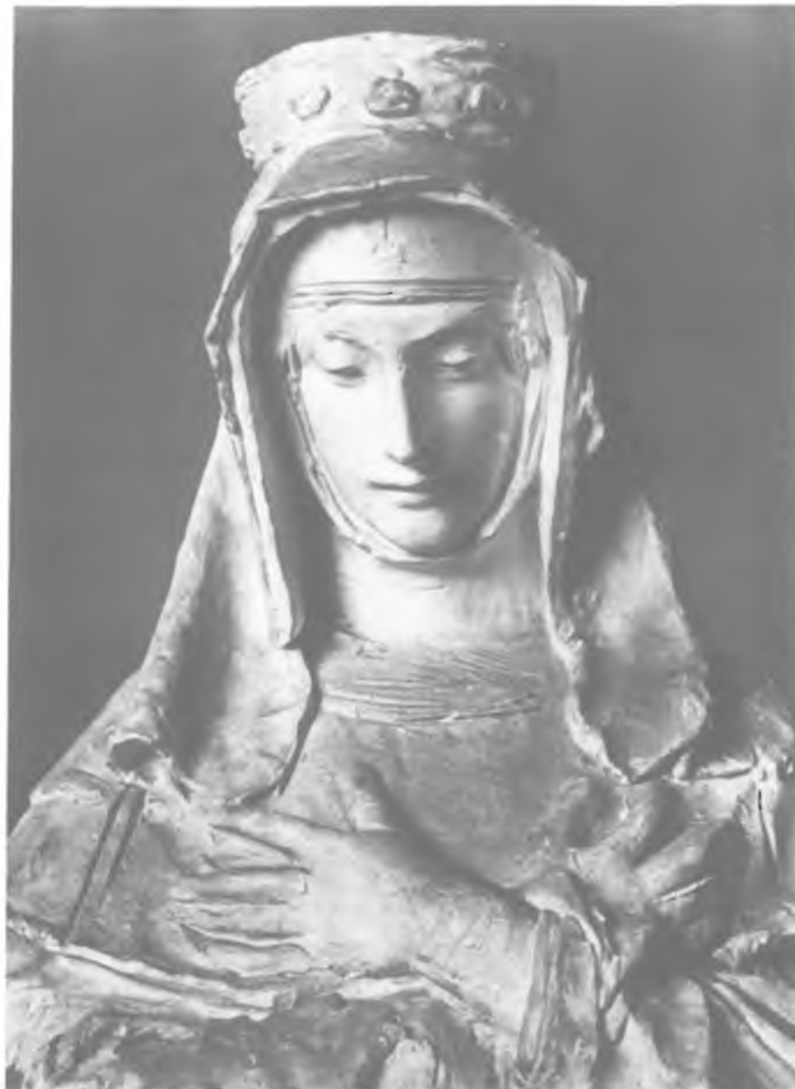
J.V.Myslbeek: Sv. Anežka Česká. Studie pro pomník sv. Václava Dcera královská, pokorná služebnice chudých

Svatá Anežka Česká se narodila asi r.1211 v Praze jako dcera slavného českého krále Přemysla Otakara I. a jeho druhé manželky Konstancie Uherské. Měla celkem třináct sourozenců a to: z prvního manželství svého otce s Adlétou Míšeňskou nevlastního bratra Vratislava a nevlastní sestry Markétu-Dagmar, Božislavu a Hedviku. Vlastními sourozenci byli Václav, který se stal po svém otci jako Václav I. českým králem, dále Vladislav, Přemysl, Judita, Anna a Blažena a krom toho Vratislav a Anežka, kteří zemřeli v dětském věku.