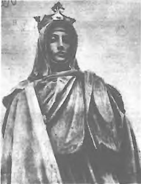
J.V.Myslbek: Detail sochy sv.Anežky z pomníku sv.Václava v Praze Kresba relikviáře s ostatkem sv.Anežky