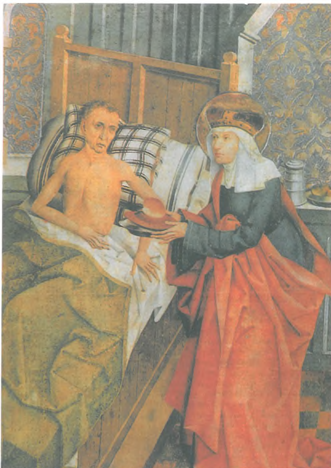
Mistr Křižovnického oltáře, kolem r.1482: Sv.Anežka ošetřuje nemocné