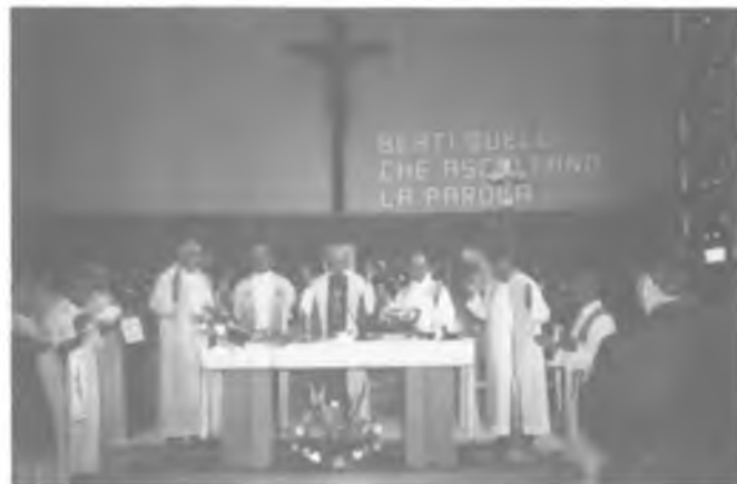
Bohoslužby při oslavě 60.narozenin P.Šimčíka.