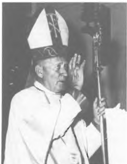
Žehnání Váru František kardinál Tomášek

O.kardinál po letošním svěcení jáhnů z českých a moravských diecezí.