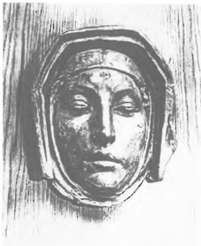
J.V.Myslбек: Bl.Anežka, maska z let 1907-11