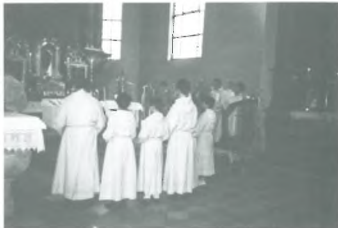
Květná neděle v Mnichově ▲ Biblický večer ve Frankfurtu ▼