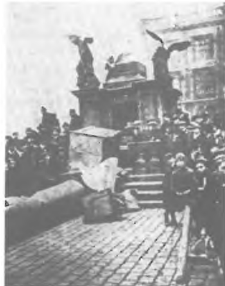
Stržený mariánský sloup na Staroměstském náměstí v Praze