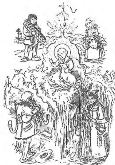
Mikoláš Aleš: Z RŮŽE KVÍTEK VYKVEŤ NÁM...

Můžete použít také tohoto konta: Tschechisches katholisches Oberseelsorgeamt, Munchen, Postgirkonto 4340 16-803, Munchen.