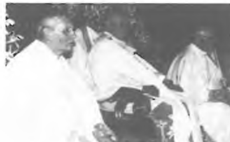
O.kardinál mezi O.Lebadou a Liškou.