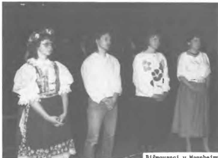
Biřmovanci v Mannheimu

ABYCHOM DOBRÝMI PASTÝŘI KE KRISTU VEDENI BYLI - PROSÍME TĚ, VYSLYŠ NÁS!