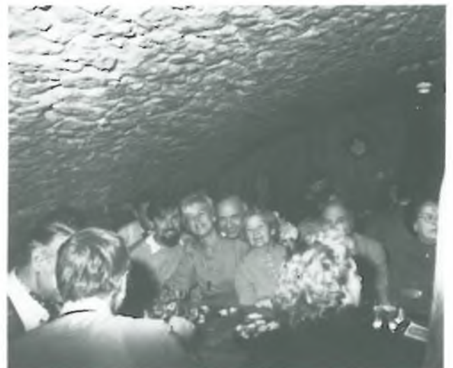
Obrázky vlevo nahoře: svatováclavské bohoslužby v Norimberku, vpravo nahoře: pouť krajanů z Kolína a Aachen vlevo dole: Frankfurtský výlet do Bad Dürkheim, vpravo: Setkání s krajany z Norimberku v Iphofen