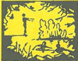
Koupali jsme se. Už plavu sedm temp a nepiju. Voda je teplá.