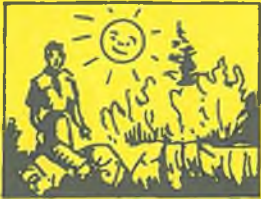
Přijeli jsme na tábor dobře. Slunko svítilo. Je tu velká louka. Večer jsme měli rizoto.