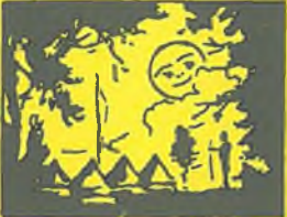
Dopoledne jsem nedělal nic, odpoledne jsem v tom pokračoval. K večeri byly brambory.