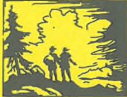
Byli jsme na výletě. Je tu moc lesů. Ztratil jsem kapesník.