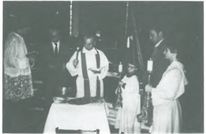
Velikonoce ve Frankfurtu: Svěcení ratolestí ▲