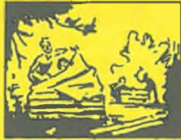
Stavěli jsme stany a podsady. Už jsem spal na pryčně. Večer mi byla zima, ale pak jsem usnul.