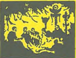
Měli jsme táborák. Nekouřil. Zpíval jsem mnoho písniček, které neumím. Mám tu dva kamarády.