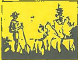
Zítřej odjíždíme domů. Škoda. Ted je to nejlepší.