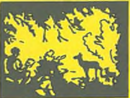
Pozoroval jsem zvěř. Srnka se nás nebála, ale pak utekla.