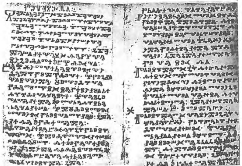
Nejstarší zachovaná staroslověnská písemná památka z Velké Moravy psaná hlaholicí: tzv. Kyjevské listy.

Proglas - veršovaná předmluva k evangeliu je nejstarší dochovaná slovanská báseň. Autorem Proglasu je pravděpodobně sv. Cyril, který sám pořídil první překlady Písma a bohoslužebných textů do slovanského jazyka.