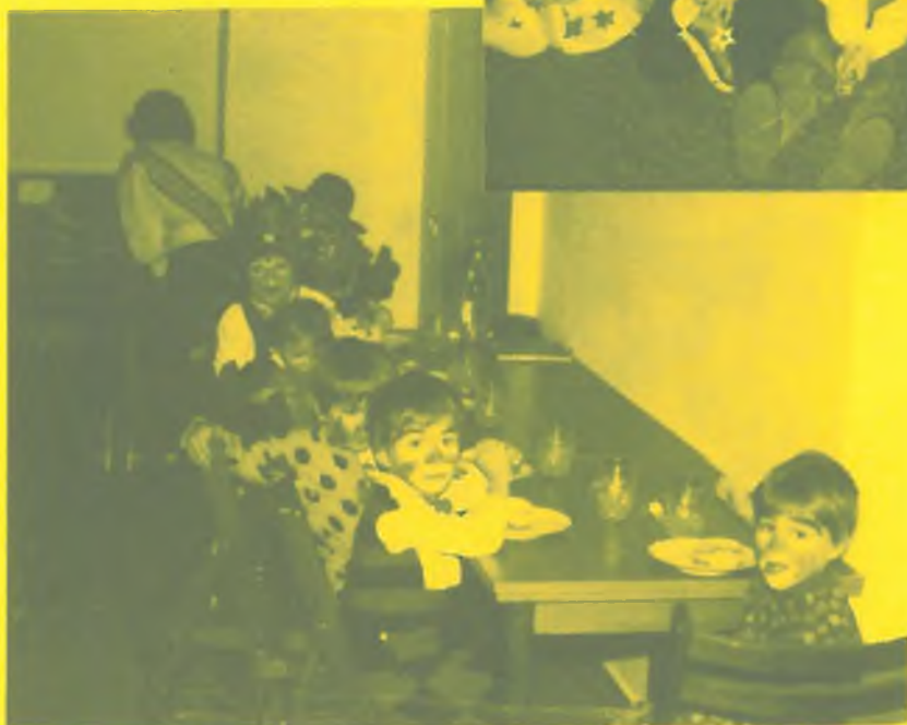
Záběry z dětského masopustu v Norimberku (nahore) a Mnichově (vlevo).