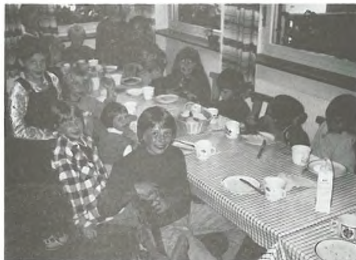
20 dětí se svými rodiči prožili podzimní prázdniny pod zářícím sluncem v Casies v jižních Tyrolích. Díky rodičům za výborný program.