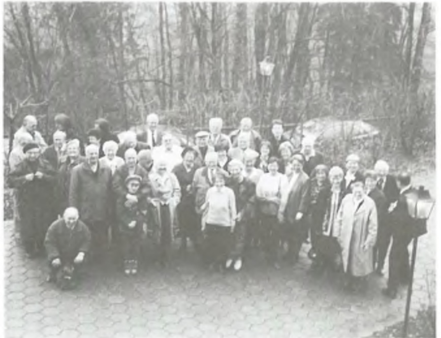
Shromáždit 51 účastníků exercicií v Klausenhofu pro dokumentární foto je velký problém. To poznáte, když je spočítáte.