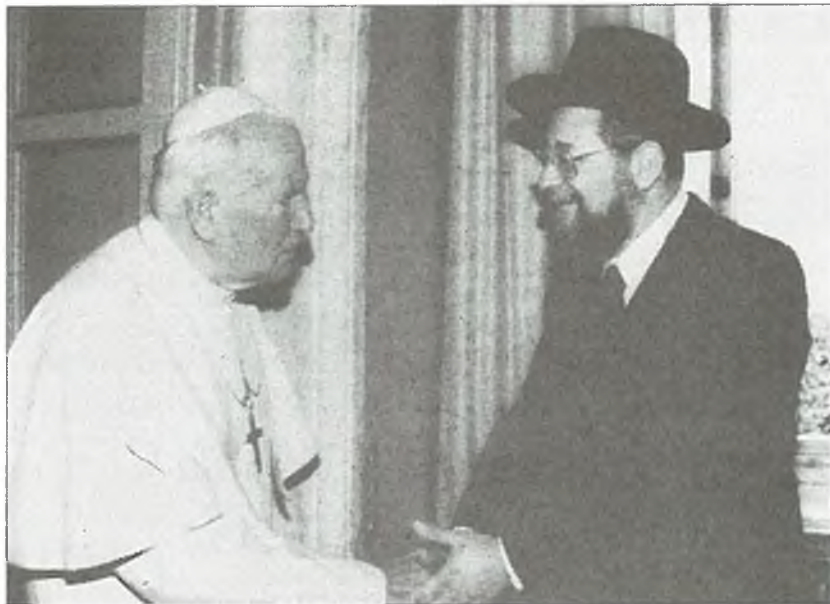
Papež Jan Pavel II. a rabín Israel Meir Lau