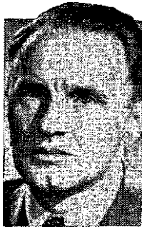
J. Kádár "Maďarský Quisling"

ďarského odporu ovšem také nemůže, tváří v tvář komunistické brutalitě, vydržet do nekonečna. V době uzávěrky HD se už malé procento stávkujících vracelo do práce.