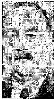
I. NAGY neúspěšný Tito

Nepovržené zprávy mluvily o tom, že Chruščev hrozil použitím Rudé armády, o šarvádkách mezi polskou a sovětskou armádou u Štětína a o pohybu ruských (Pokračování na str. 2)