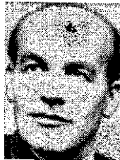
V. GOMULKA úspěšný Tito

Uprostřed schůze ústředního výboru polské komunistické strany spadl na varšavské letišti nečekaný náklad ruských bolševiků. V jeho čele: Hrušev, Molotov, Kaganovič, Mikojan a maršalové Žukov