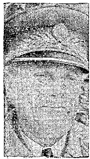
Maršál Tito Naděje Kremľu?

Po východoněmeckém Grotewohlvi se objevil v Československu dr. Achmed Sukarno, president Indonésie a jeden z předních neutralistů. V Československu se zastavil na cestě z Moskvy. Po moskevském vzoru dostavila se komunistická vláda i se soudruhem presidentem na letiště v Ruzyni, aby na bývalého kolaboranta s Japonci