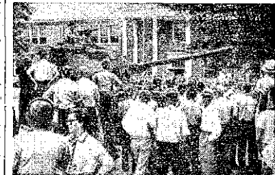
V Americe - na obranu demokracie

Tanky v ulicích nejsou nikdy příjemné na pohled. V ulicích demokratické země vypadají dvojnásob ošklivě z velmi jednoduchého důvodu: jsou hrnatařelým důkazem, že demokracie té či oné země je ohrožena. V diktatuře jsou tanky předměty domácího pochyby: pokud nestojí na náročích, aby byly všem občanům na očích, říjí hův v jejich státu celý život. V diktatuře stojí tanky ve službách vlády. V demokratické zemi musí někdy chránit práva většiny občanů před zvláštní násilné menšiny.