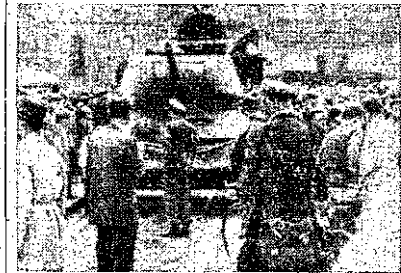
V sovětském světě - na obranu tyrane

Právě v těchto dnech koná se v Polsku proces s polskými dělníky, kteří se účastnili poznánské vzpoury proti polským komunistům. Obžalovaných je pry celkem 154. Přítomnost západních právníků pozorovatelů při procesu svědčí o tom, že se komunisté pomstili podle osvědčených tradic na těch, kteří měli to neštěstí, že byli dopadeni, jinak než v soudní síni. Několik by se měl zeptat, co se na příklad stalo s Poláky, kteří byli chyceni v Československu, a kteří byli vydáni Polsku. Na lavičce obžalovaných sedí hrstka zlomených lidí, kterým může státní zástupce připisat zločiny proti lidskosti, které, jak víme sami až moc dobře, jsou neodlučitelnou částí politických bouří.