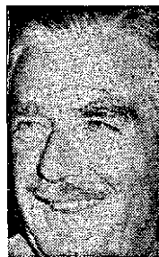
Sir Anthony Eden Zákeřek ospravedlnitelý

Suezská posádka by musila permanentně čelit