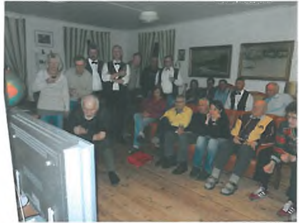
5. Spolu s muzikanty jsme stihli sledovat i MS v hokeji a Svedsko jsme porazili