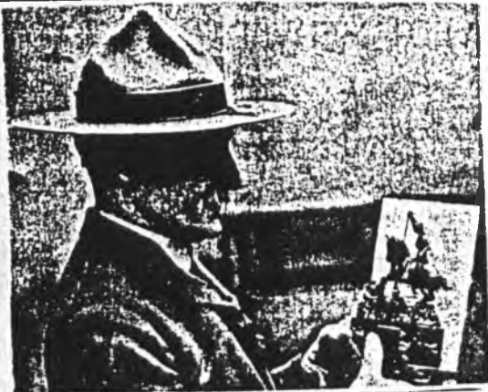
Na snímku z roku 1931 je B-P s darem čs. skautů - soškou sv. Jiří.