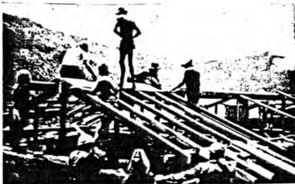
Západoněmečtí skauti budují v rámci prázdninové aktivity školu v Nepálu.

V Burkiné Faso se loni v srpnu konal důležitý seminář o skautingu pro tělesně postižené. Zúčastnilo se ho 32 skautských vůdců z pěti afrických zemí. Jeho tématy byly: zajištění zdraví dětí, předcházení tělesného postižení a zapojení mladých hendikapovaných lidí do skautingu a společnosti. Seminář poskytl také příležitost pro vyzkoušení jak dalece je použitelná příslušná literatura.