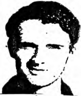
JAN PALACH *11. 8. 1948 †19. 1. 1969

Na vysokých školách v celé republice zahájili studenti hladovku a stávky na podporu Palachových požadavků. Téměř ve všech městech republiky proběhly pietní demonstrace. V den pohřbu obkličily Prahu sovětské tanky. Přesto se do ulic města přišlo s Janem Palachem rozloučit přes půl milionu lidí. Byli to ti, které chtěl svým činem probudit. Byla to část národa, který se ocitl na okraji beznaděje po celonárodním odporu proti srpnové okupaci. Stáli v úctě před jeho činem, zasažení až na dno lidské podstaty jeho oslovením.