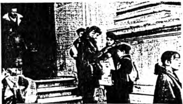
Arménští skauti v exilu konají sbírky pro zemětřesená postižená města Arménie.