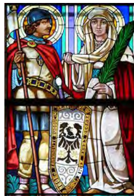
Svatý Václav (asi 907 - 28.9.935) a jeho babička Svatá Ludmila

se bude konat v neděli, 28. 9. 2008 na Šumavě.