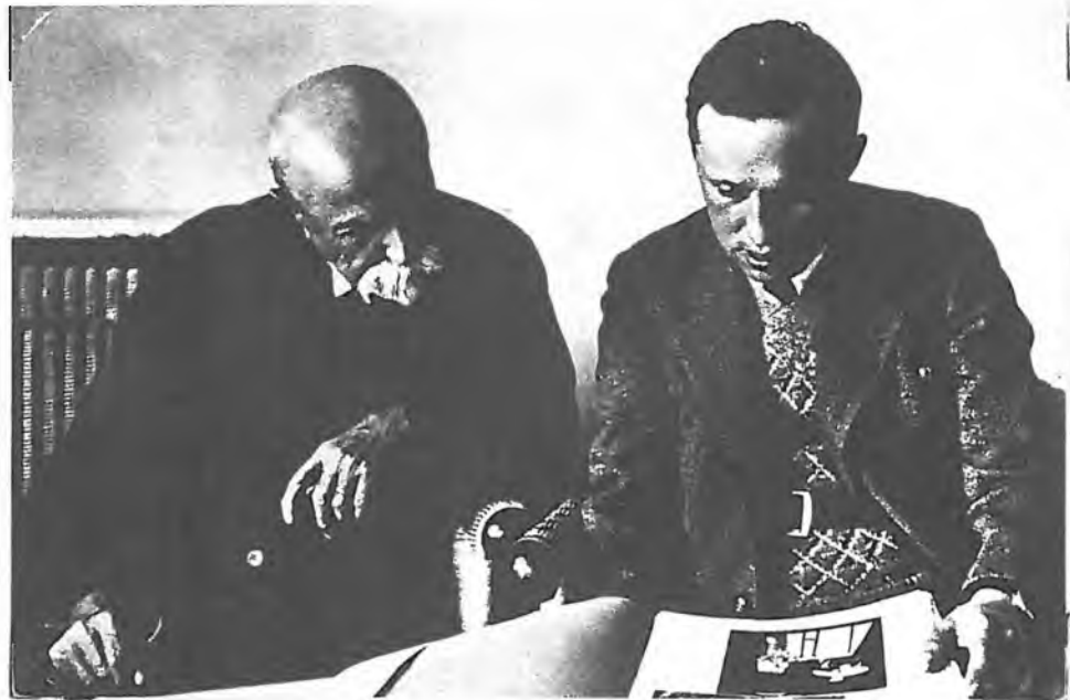
1931-se spisovatelem Karlem Čapkem v Bystřičce